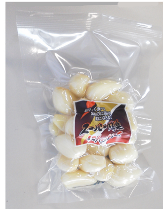
スーパー消臭にんにく むきにんにく 内容量 100 g