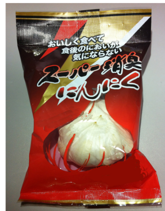
スーパー消臭にんにく 内容量 1 玉